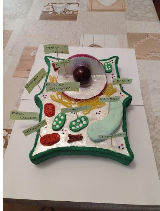
Cellula vegetale Nicole Cirillo