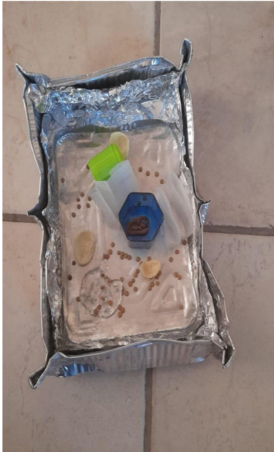
Cellula vegetale, Bimbi Matteo