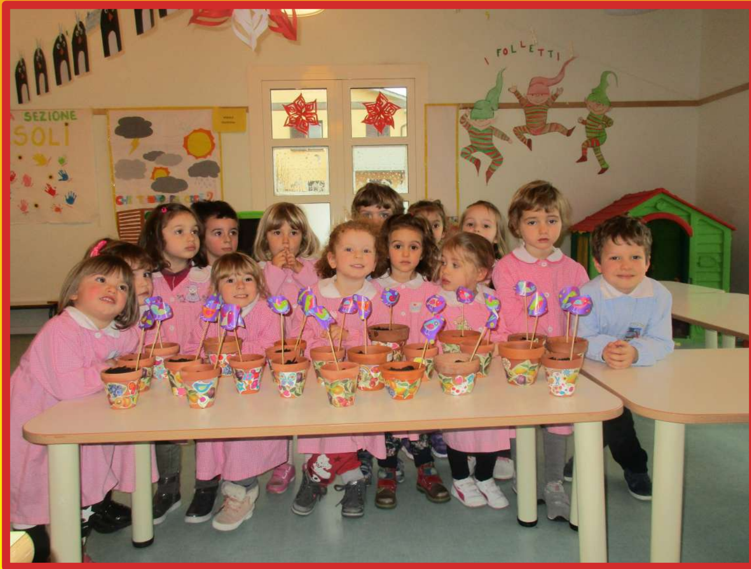
Elemento TERRA: "Amica terra...dal seme al Girasole"